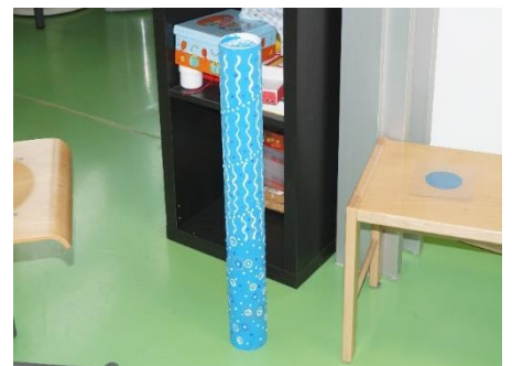
Das angemalte Rohr