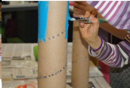
Das Anmalen der Rohre